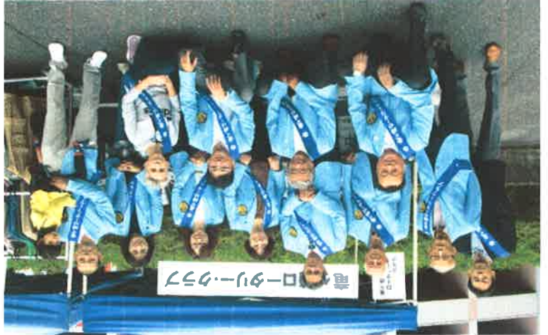
10/20(日)「ふれ愛広場/サー」於：龍ヶ崎文化会館前駐車場

60周年記念事業ではないので、実行委員会から外し、予算も含めて地区関係だけで進めたいと思います。 石碑に彫る会員の名前については、地区大会当時(2016年6月30日現在)に在籍していた会員の名前を彫 るようにしたいと思っておりますので、皆様にご了解を頂けますよう直し<お願いいたします。 設置時期としては、来年の4月～6月くらいと考えております。何卒ご協力の程を直し<お願いいたし