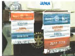
R 財団より表彰:2018-19 年度