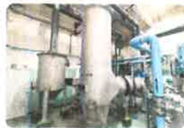
オーバーフローシャフト