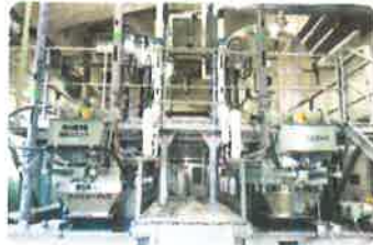
ドラムスクリーン・スクリュープレス