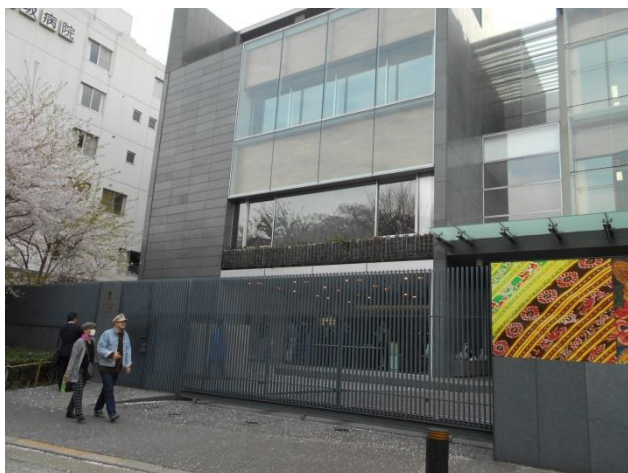
次はインド大使館です