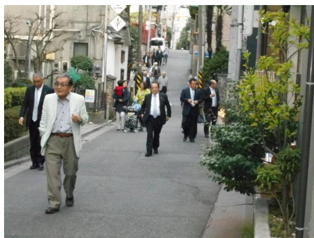
神楽坂は結構急だな...