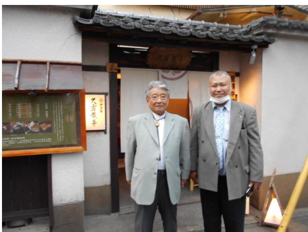
久露葉亭で打上げです