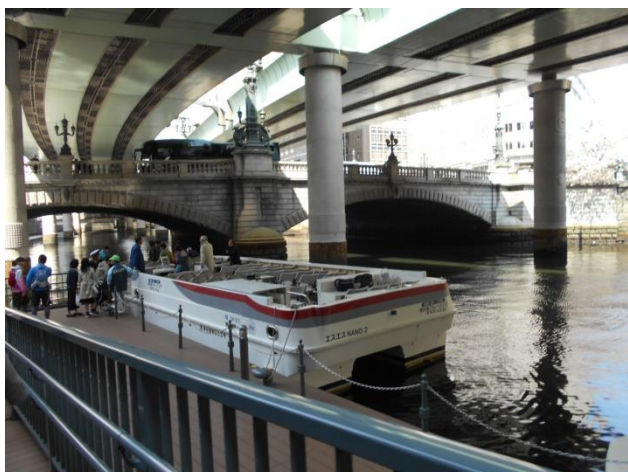
まずは本日の手始めに日本橋船着場からスタート!