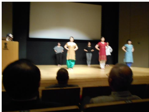
ステージで披露してくれた華麗な舞い