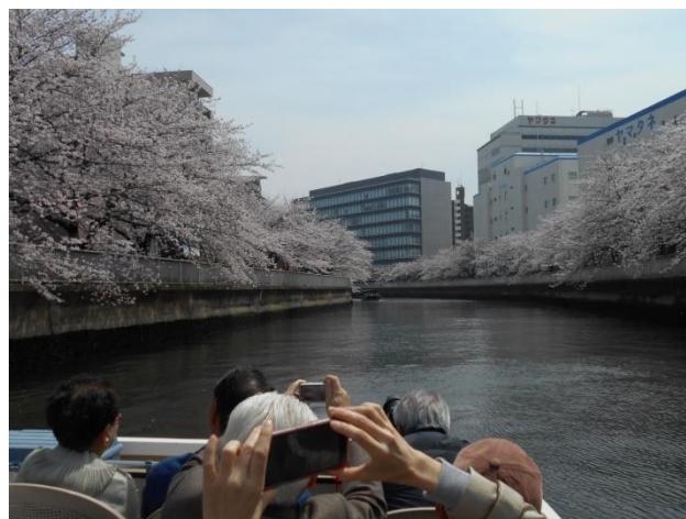
日本橋川から神田川へ