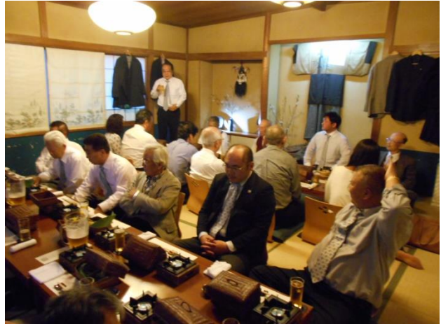
会長の乾杯で盛り上がりました