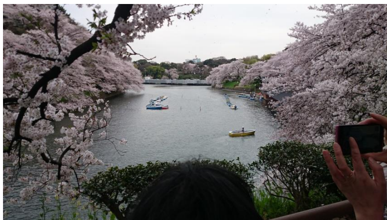
ワープして千鳥ヶ淵