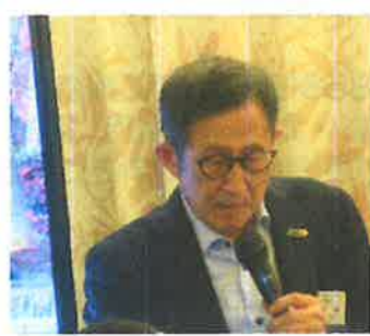
佐伯広報・公共イメージ委員長